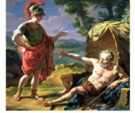
Göle etme başka insan istemem.

Kinizm; zenginlik, güç, şöret gibi bütün insani duyguları terk edip her şeyden uzak yaşamayı benimseyen bir düşünce biçimidir. Kinizm için var olan temel kavramlar; doğa, akıl, kendi kendine yeterlilik ve özgürlüktür.