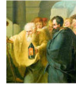
Diyojen MÖ 412 - MÖ 323 yılları arasında yaşamış Kinik felsefesinin öncüsü ünlü filozoftur.

Dünya malını hor görmüş ve her türlü insan tutkusundan uzaklaşmayı savunmuştur. Ona göre insan istek ve gereksinimlerini en aza indiren ve böyle yaşayabilirse gerçek anlamda mutluluğa ulaşabilecektir.